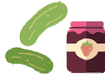
Mermeladas, gelatinas, jaleas, encurtidos y salsas