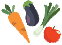
Frutas y vegetales

Puede usar la tarjeta P-EBT para comprar lo mismo que compraría con los beneficios SNAP. La mayoría de los artículos de comida son elegibles: