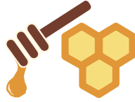
Miel y maple